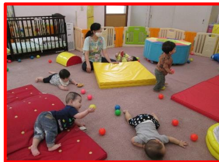
〔 運動あそび 〕

マットのお山を登ったり、鉄棒にぶらさがったり、体を動かす気持ちよさを体験し、自ら体を動かそうとする意欲を育てます。