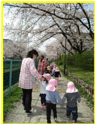
( 園近くの桜並木道 )