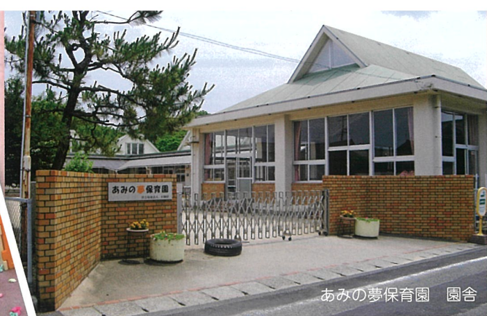
あみの夢保育園 園舎

学童クラブ ● 平日（月～金） 放課後～19:00 小学校の休校日 7:30～19:00