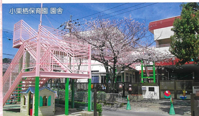
小栗栖保育園 園舎