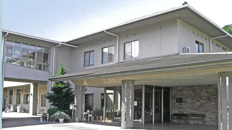
天ヶ瀬寮 外観 ▲