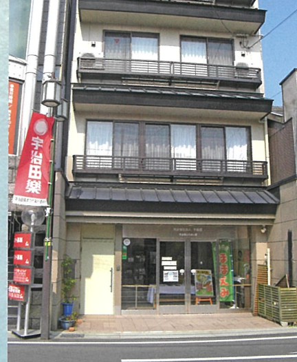
宇治橋ふれあい館 外観 ▲