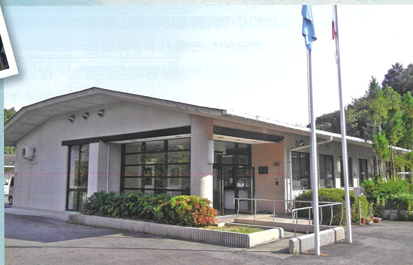
天ヶ瀬きぼうの家 外観▶