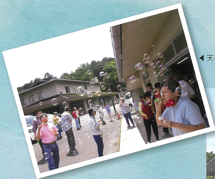
◀ 天ヶ瀬ワークスあすなる

ご家庭で一時的に支援・介助が受けることが出来なくなった方や、入所体験が利用出来る短期入所事業所も併設しております。