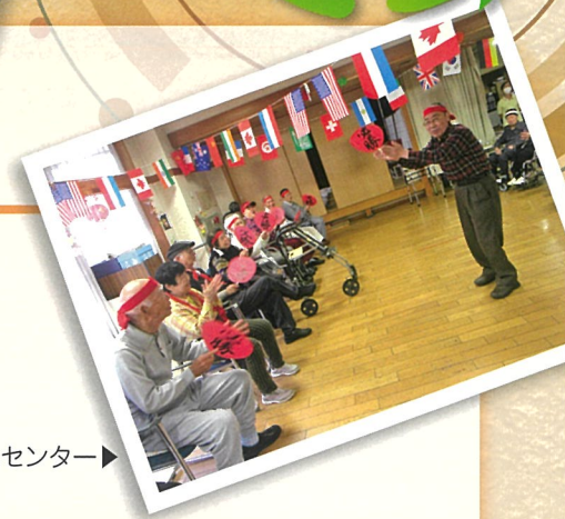
天ヶ瀬苑 デイサービスセンター▶