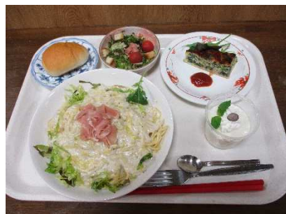
写真（おまかせ料理）