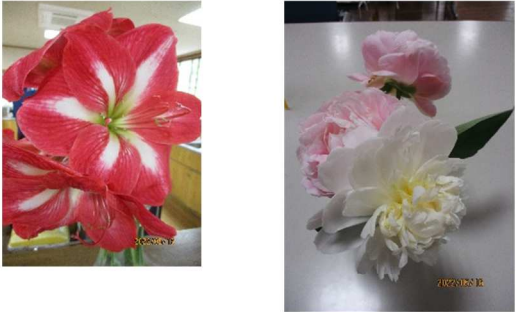
写真（利用者様から頂いた花）