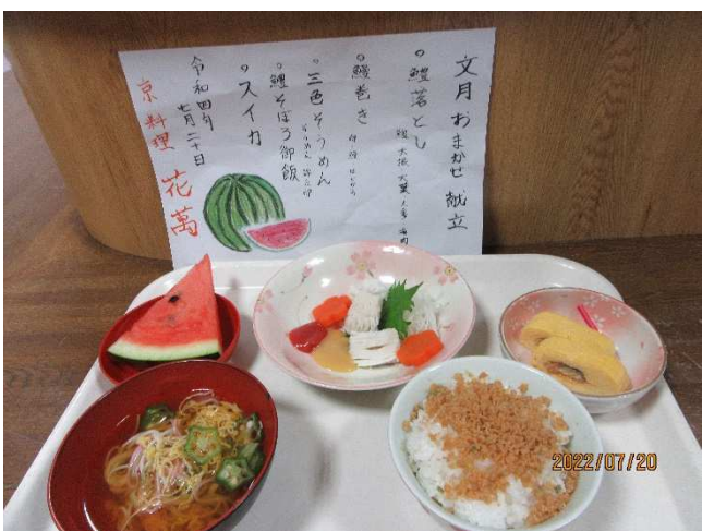
写真（おまかせ料理）