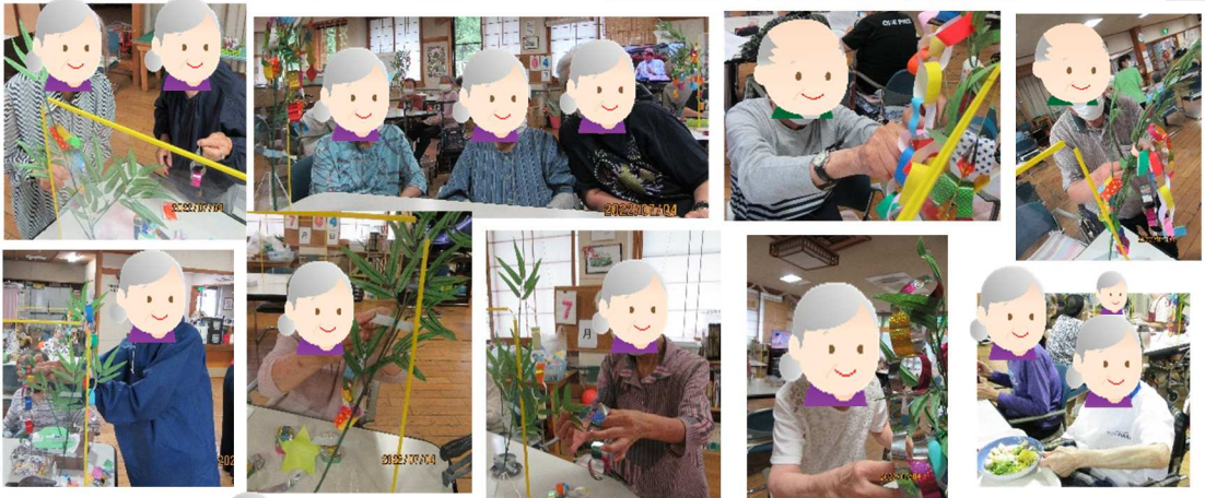
写真（七夕祭りの様子）

7月7日（木）に七夕まつりを行いました。当日までに利用様に手伝って頂き、笹に短冊などの飾りつけをして頂きました。