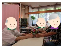
写真（誕生日会の様子）