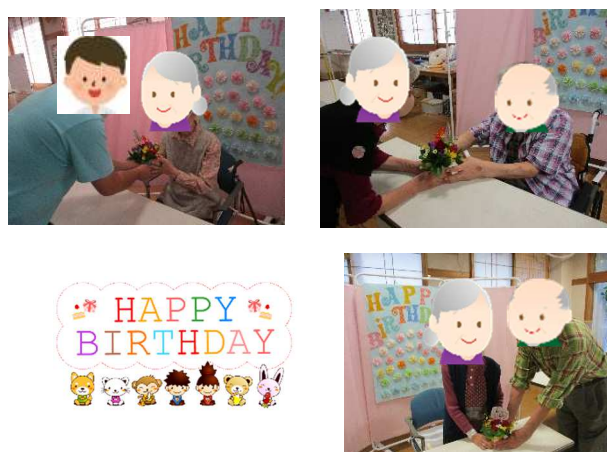
写真（誕生日会の様子）

撮った写真は誕生日カードとして、プレゼントしています。10月は3名の方をお祝いしました。