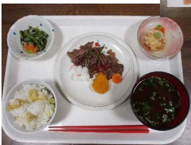
写真（おまかせ料理）