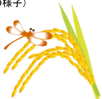
実るほど頭を垂れる稲穂かな

10. 月は「実りの秋」ということで、わくわくおやつは、秋らしい黄金色の稲穂を思わせるような色彩の「みのりもち」をいただきます。