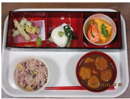
写真 (おまかせ料理)