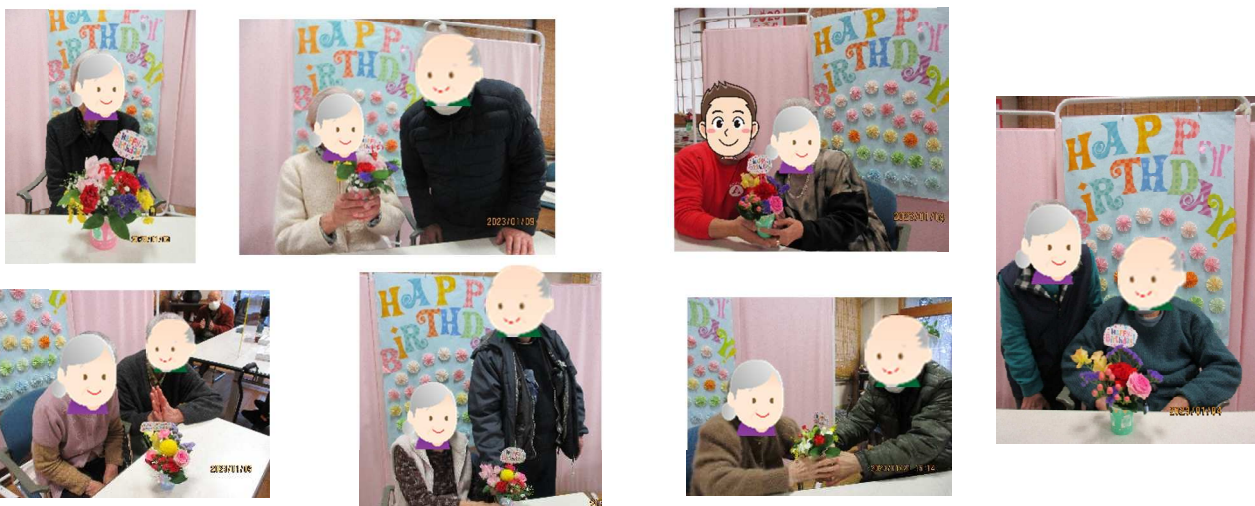
写真 (誕生日会の様子)

撮った写真は誕生日カードとして、プレゼントしています。1月は7名の方をお祝いしました。