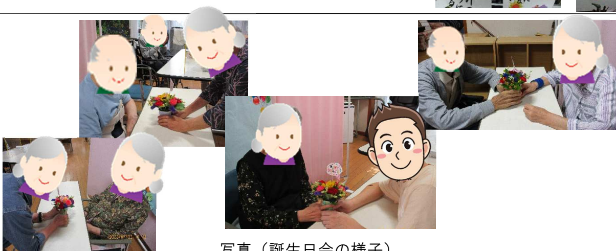
写真（誕生日会の様子）

お誕生日の日や近い日に毎月該当の利用者様に前へ出てきて頂き、お花の贈呈と写真撮影をし、その後、皆でハッピーバースデーの歌をプレゼントしています。 歌の後には、誕生日の方から一言頂き、日ごろ思われていることなどを皆さんに伝えて頂いています。 撮った写真は誕生日カードとして、プレゼントしています。7月は4名の方をお祝いしました。