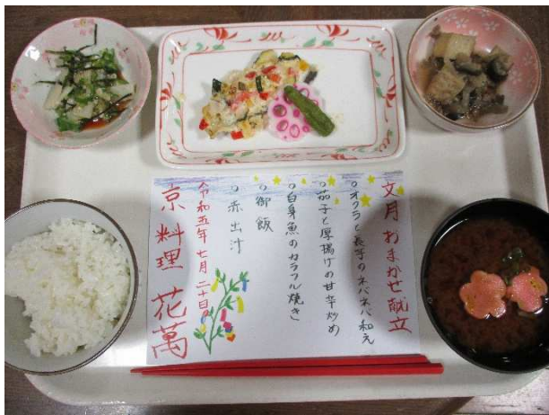
写真（おまかせ料理）