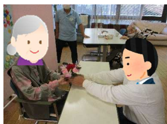
写真（誕生日会の様子）