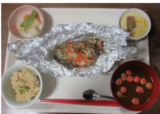
写真（おまかせ料理）