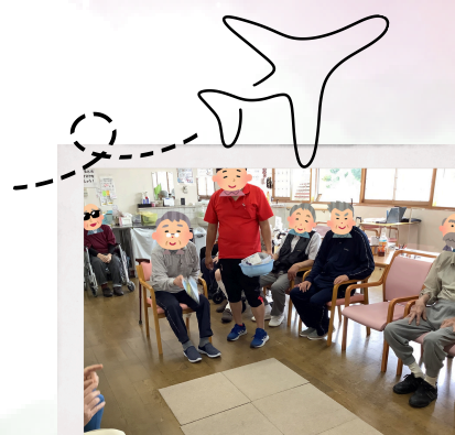
飛んで飛行機ゲーム