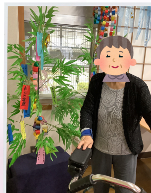
お願い事を書いて いただきました