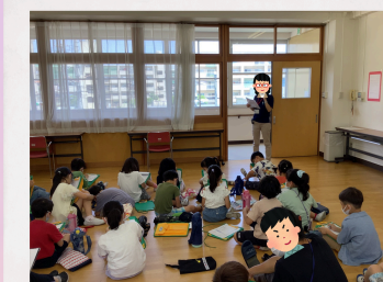
町探検で 来所されました