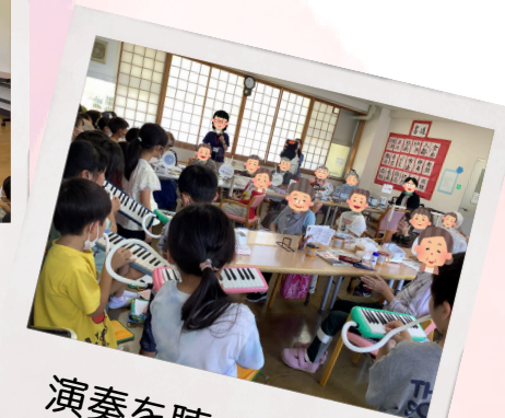
演奏を聴きました