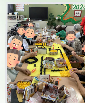
皆さんで創作活動